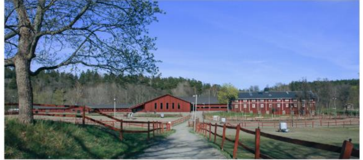
Planerad gestaltning, vy från vägen mot anläggningen