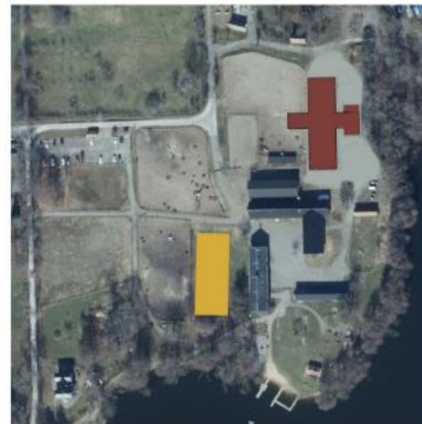
nytt stall byggs