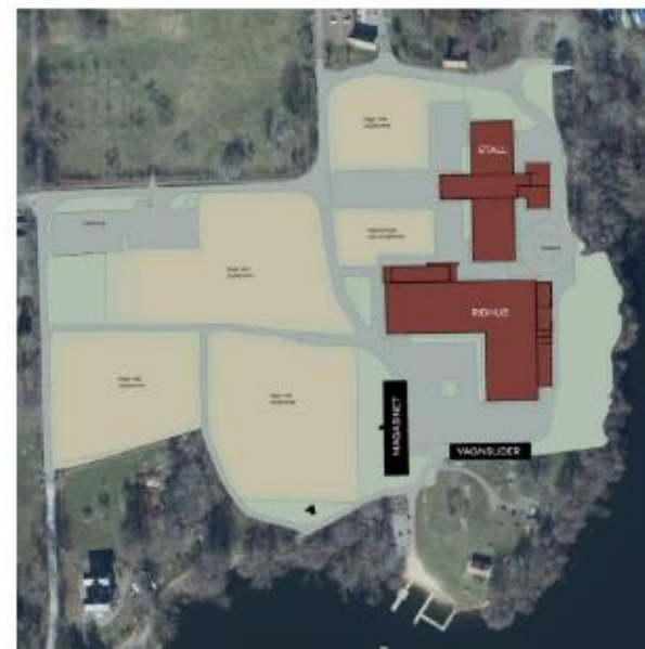
nya hagar, skyddszoner mm.