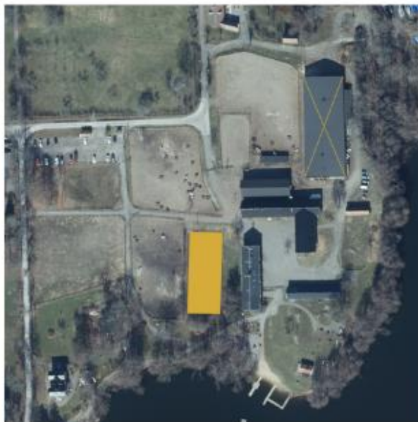
befintligt ridhus rivs och tält för tillfälligt ridhus sätts upp