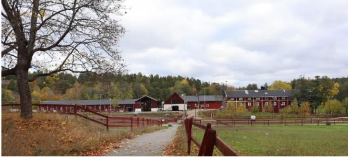
Befintlig vy från vägen mot anläggningen