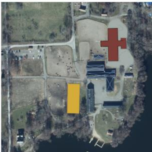
gammalt stall rivs