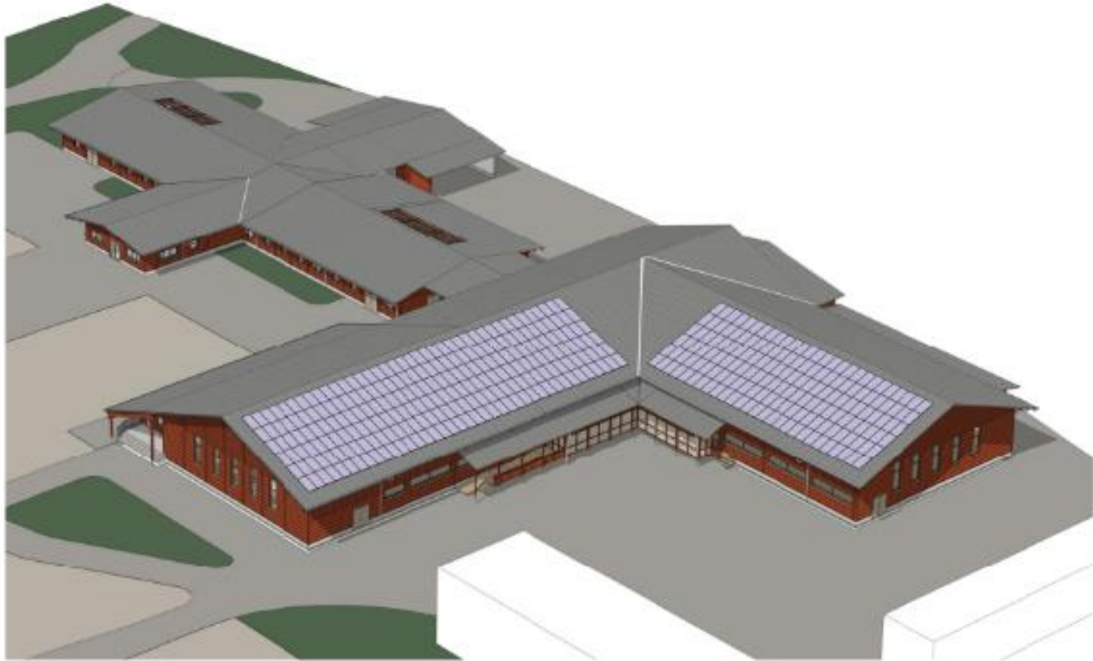
Planerad gestaltning, flygperspektiv från sydväst.