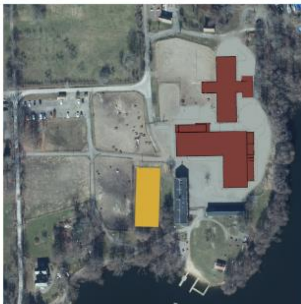
nytt ridhus byggs